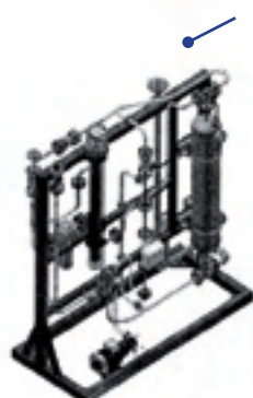
● Tuyauterie industrielle ● Nucléaire