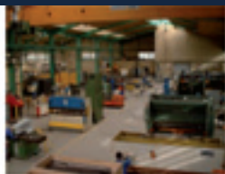
Atelier de fabrication du lycée : ● Découpage PLASMA CN ● Poinçonnage CN ● Pliage CN