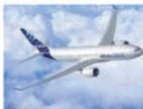
● Aéronautique ● Maintenance