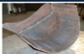
Travail : ● Tôles épaisses (travaux publics, ponts, pétrole, naval,...) ● Tôles minces (carrosserie industrielle, automobile,...) ● Soudage aciers, aciers inoxydables, alliages aluminium (agriculture, industries alimentaires,...)